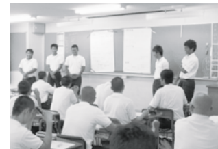
高1知財 プレゼン風景

5月から2か月(7時間)をかけて、生徒達が各グループのテーマに従って調べた内容を各教室でプレゼンテーションしました。「携帯電話」「ペットボトル」「コンタクトレンズ」「自動販売機」「エアコン」「iPod」「iPad」「回転寿司」「カーナビ」「自動車」など、いろいろな種類の商品・サービスについて社会的影響のプラス面、マイナス面を調べ、各班が自分達の問題としていろいろな提言を行ってくれました。