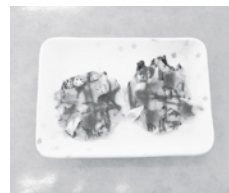
↑愉快的一口ピザ(100円)