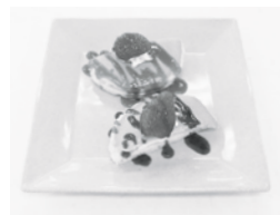
↑ホットケーキサンド(120円)

が織り込まれており、いずれも个性的で目を引くものばかりでした。期間・個数の限定販売で、好評の中完売しました。何度も試作を重ね多大なるご協力をいただいた食堂店長に感謝致します。