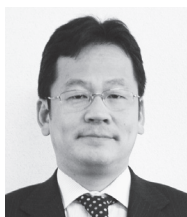
中等部教頭・生徒募集対策室室長